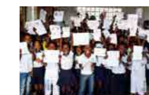
← LOS BENEFICIARIOS DIRECTOS DE ESTE PROYECTO SON 1.600 NIÑOS Y NIÑAS DE ENTRE 6 Y 12 AÑOS.