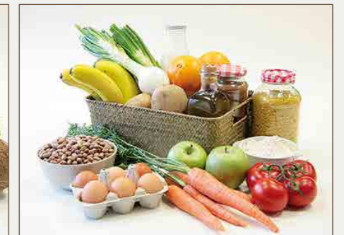
Cesta de Perú 40€

Escoge tu cesta llamando al número de teléfono gratuito 900 20 13 20 o entrando en cestascontraelhambre.globalhumanitaria.org