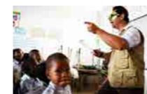
← TRABAJAR CON TODA LA COMUNIDAD EDUCATIVA ES FUNDAMENTAL PARA EL ÉXITO DEL PROYECTO.