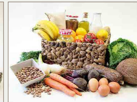
Cesta de Colombia 38€