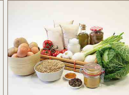
Cesta de la India 22€

El contenido de cada una de las cestas incluye productos básicos y necesarios para alimentar durante una semana a una familia de 6 miembros . La cesta que regales irá destinada a los proyectos de seguridad alimentaria como comedores y huertos escolares.