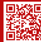
← VISITAS TÉCNICAS A CRIADORES DE ALPACAS EN CHULLUNQUIANI

Puedes ver más sobre el proyecto Sumak Mikhuna en este vídeo: