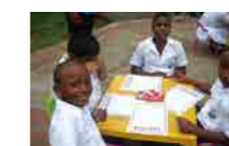
← NIÑOS BENEFICIARIOS DEL PROGRAMA DE APADRINAMIENTO, ESCRIBEN A SUS PADRINOS EN LA BICIBIBLIOTECA.