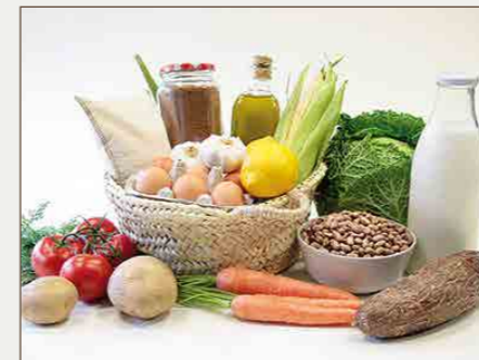
Cesta de Guatemala 34€