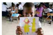
↑ TALLER ESCOLAR EDUCACIÓN PARA LA PAZ, EN TUMACO. GLOBAL HUMANITARIA