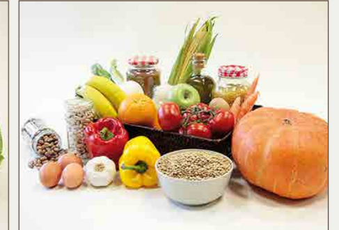
Cesta de Bolivia 26€