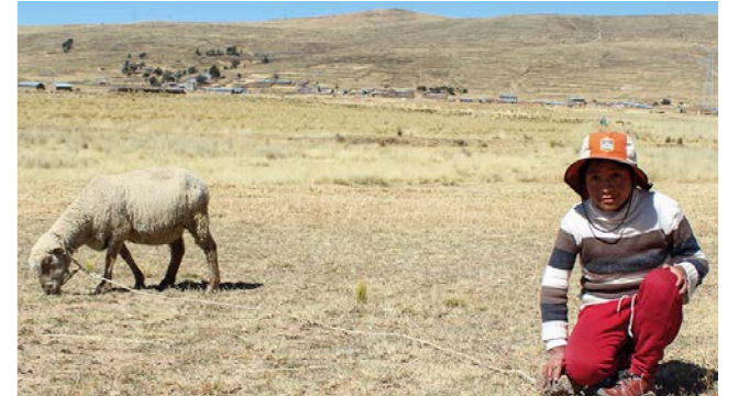
"Me levanto a las 6:00h de la mañana para ayudar a mi mamá a preparar el desayuno. Además de esto soy la encargada de dar de comer a los animales, a nuestro cerdo y seis ovejas. Cuando acabo me siento a desayunar con mi familia."