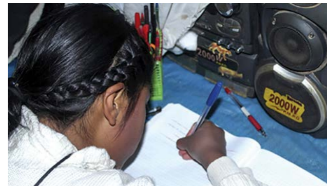
"Me he registrado para hacer clases del programa 'Aprendo en casa' del Ministerio de Educación. Lo hago mediante Facebook y también adelanto el material que mi profesor me proporciona por WhatsApp. Tengo clase a las 10:00h y a las 16:30h usando, como complemento, la radio."