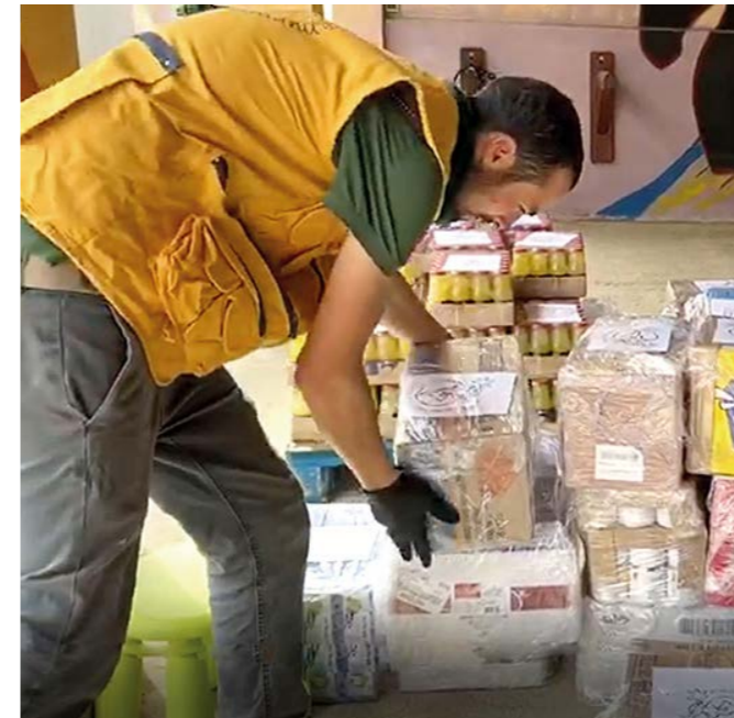
Envío de alimentos envasados y productos de higiene a IFEMA (Madrid).

Con el fin de atender las necesidades urgentes causadas por la pandemia y en colaboración con las autoridades competentes, tras conocer las necesidades aún no cubiertas en hospi-