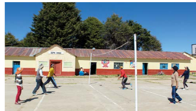
"A mediodía ayudo a hacer el almuerzo que, por la pandemia, no lleva muchos ingredientes. Cuando terminamos los miembros de mi familia se dividen en dos equipos para disputar un partido de vóley. En la noche nos reunimos para la última comida del día, nos sentamos a cenar y luego a descansar."