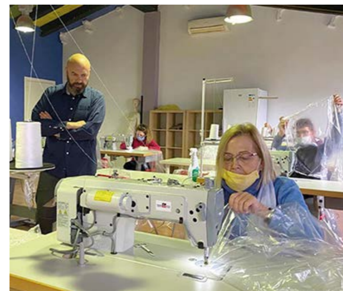
Fabricación de batas por voluntarias en Vilafranca del Penedès.

Todas estas acciones que hemos llevado a cabo en nuestro país, no hubieran sido posibles sin el apoyo de nuestros padrinos y madrinas, socios y donantes . Su colaboración es clave para que, juntos, podamos evitar que el presente y el futuro de nuestra sociedad y la de los países donde cooperamos se vea comprometido.