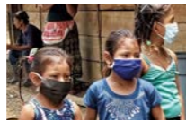
COMUNIDAD SANTA MARTA MACHACA III, POPTÚN (GUATEMALA) GLOBAL HUMANITARIA