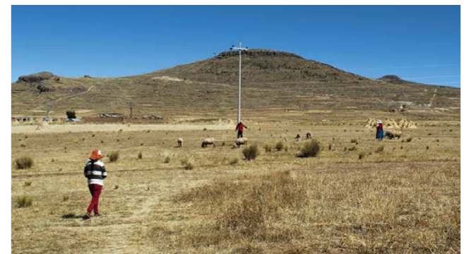
"Esta enfermedad nos ha afectado mucho ya que mis papás no tienen trabajo y tampoco les tocó ningún bono solidario, ya no saben de dónde sacar plata. La gente de mi comunidad está vendiendo su ganado. Ya tuvimos dos alertas en Paucarcolla de coronavirus, por eso quiero que todo el mundo se cuide mucho."